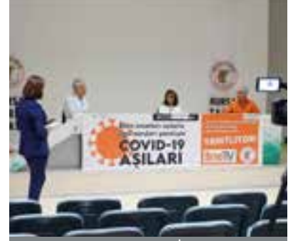
S86 Uzmanlar Aşılarla İlgili Soruları Yanıtladı