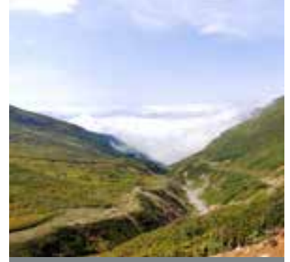
S42 Dünyayı Gezelim