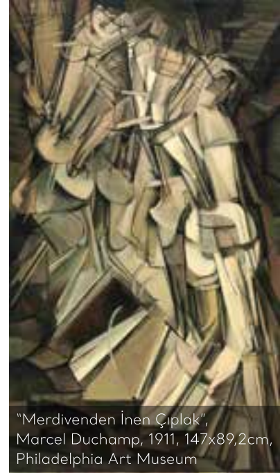
"Merdivenden İnen Çıplak", Marcel Duchamp, 1911, 147x89,2cm, Philadelphia Art Museum

Dünya savaşlarından sonra her şeyin, sanatın bile anlamsız olduğunu düşünen Dadaist akımın öncüsü olacak Marcel Duchamp kendi sanatsal varoluşu içinde Heidegger'in bahsettiği tarzda bir krizi yaşayan ve eserlerine yansıtan avangard bir sanatçıdır. Onun "Merdivenden İnen Çıplak"/"Nude Descending a Staircase" isimli tablosu, insanın robotlaşmaya gidişini gözler önüne sererken, Fütüristlerin aksine teknolojiye eleştirel bir tavır alır.