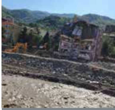
S13 Sel Felaketinden Gözlemler