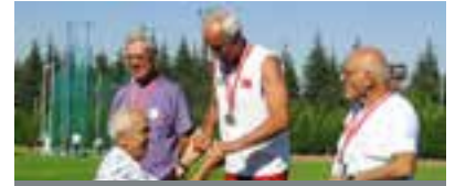
S77 Dr. Kaçar'dan 1 Atlin 1 Gümüş