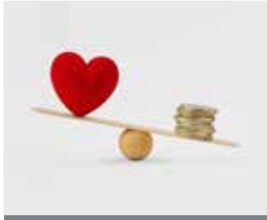
S32 Sağlıkta Eşitsizlikler