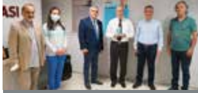
S36 Bursa Tabip Odası 68 Yaşında