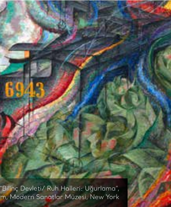
"Bilinç Devleti/ Ruh Halleri: Uçurlama", m, Modern Sanatlar Müzesi, New York

resmi, ilk göz atışta ışığı ve rengi şeritlere ayırarak kübist öğeler taşıyan, bölmece bir teknik ile yapılmıştır. Ressam resimde bir dördüncü boyuttan bahsetmiştir. Boccioni'ye göre bu boyut oylumdur. Bu sayede akış ve zaman resme eklenmiştir. Kübist resimde ressam zamanı durdurur ve nesnesine farklı açılardan bakarak resmeder. Burada kübik bakış açısıyla zamanın akışı birleştirilmiştir. Böylece seyircisinin de esere katılması düşünülmüştür. Kompozisyonun merkezinde uzaklaşan trenin ışıkları bulunan, çizgiler ile perspektif hissi verilen ve kullanılan renklerin tonlarının derinlik kattığı tabloda, ortadan etrafa doğru dalgalar eşliğinde hareketin oluşumu yönlendirilmiş, insan betimlemeleri ise ritmik