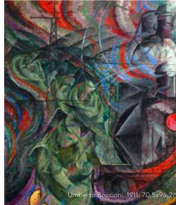
Umberto Boccioni, 1911, 70,5x96,2cm

Umberto Boccioni’nin “Ruh Halleri”/ “Statid’animo” serisi içinde yer alan “Uğurlama”